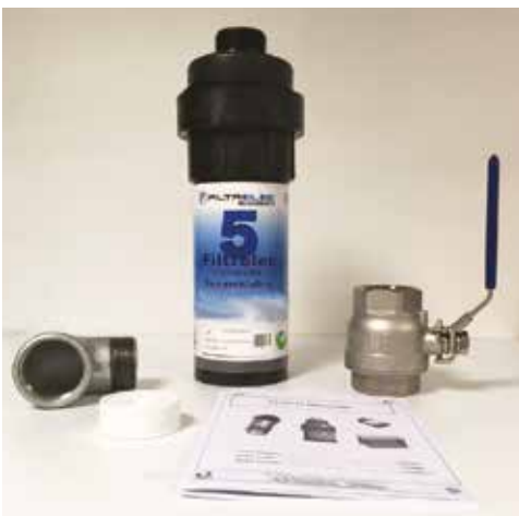
Débit de 5 litres/minute en écoulement gravitaire

FILTRELEC® est une alternative technico-économique aux décanteurs et séparateurs traditionnels.