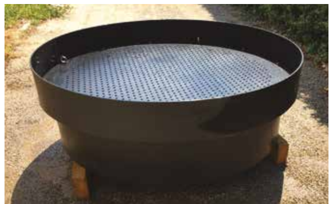
Débit de 1500 litres/minute en écoulement gravitaire