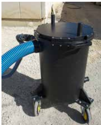
Débit de 50 litres/minute pompé